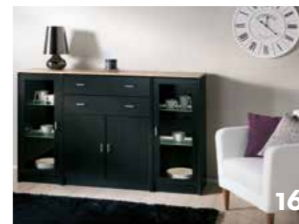
SVARTBETSAD ASK MUSTA SAARNI BLACK ASH

Birch is a genuine Scandinavian tree - beautiful when white stained. All visible edges are made from solid woods. Timantti gives you a wide range of options, including wood framed beveled glass doors.