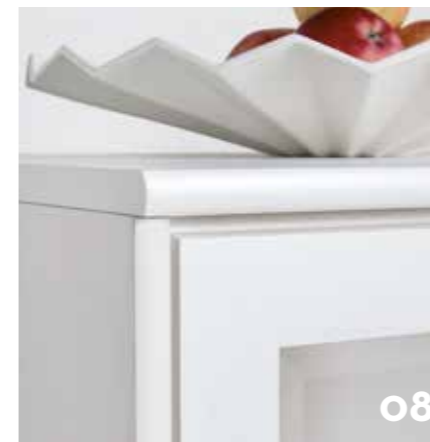
VITBETSAD BJÖRK KUULTOVALKOINEN KOIVU WHITE STAINED BIRCH

Oak, which is used in Timantti, is one of the finest wood species in furniture. Oak has a beautiful figured veneer.