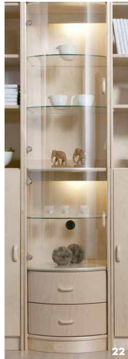
BJÖRK NATUR KOIVU NATUR NATURAL BIRCH

Genuine Scandinavian - long-lasting wood. The colour of birch can vary from light yellow to moderate white or reddish hue.