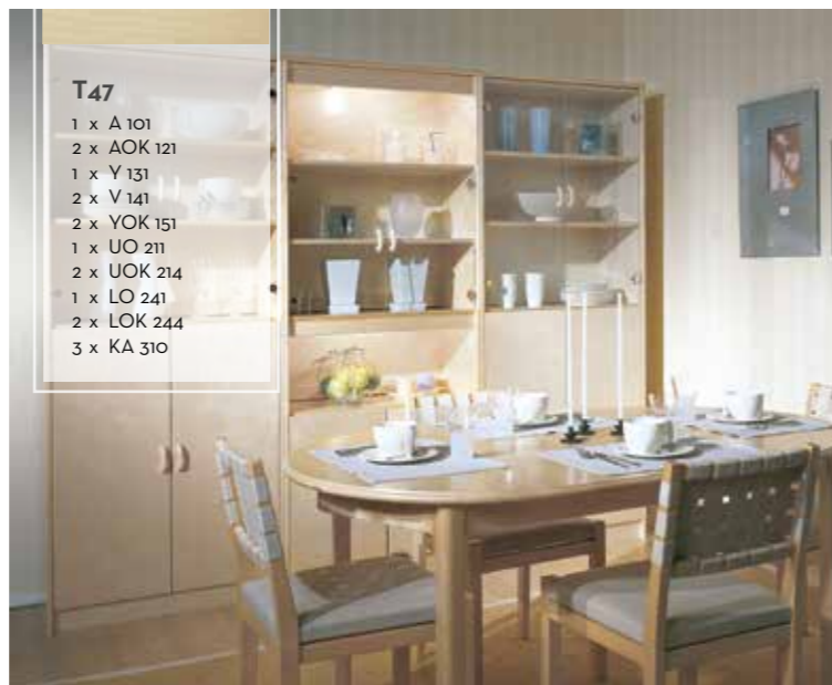
T47 1 x A 101 2 x AOK 121 1 x Y 131 2 x V 141 2 x YOK 151 1 x UO 211 2 x UOK 214 1 x LO 241 2 x LOK 244 3 x KA 310