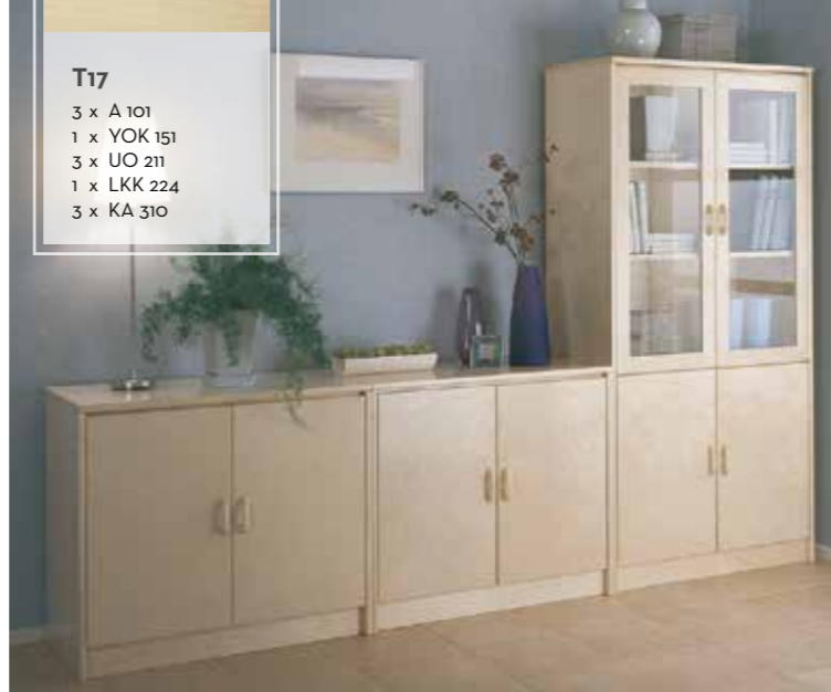
T17 3 x A 101 1 x YOK 151 3 x UO 211 1 x LKK 224 3 x KA 310