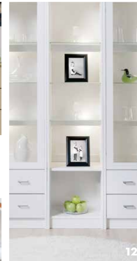
VITLACK MAALATTU VALKOINEN WHITE LACQUER

Ash is very strong and resilient wood - with a wavy and curly grain. It has a beautiful depth when stained in black. A modern choice for the bold decorator.