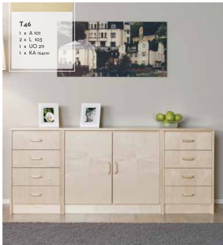
T46 1 x A 101 2 x L 103 1 x UO 211 1 x KA 164cm