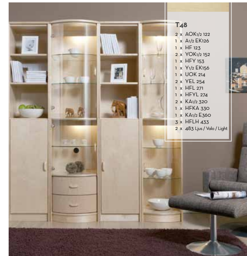
T48 2 x AOK 1/2 122 1 x A 1/2 EK126 1 x HF 123 2 x YOK 1/2 152 1 x HFY 153 1 x Y 1/2 EK156 1 x UOK 214 2 x YEL 254 1 x HFL 271 1 x HFYL 274 2 x KA 1/2 320 1 x HFKA 330 1 x KA 1/2 E360 3 x HFLH 433 2 x 483 Ljus / Valo / Light

Birch is Finland's beloved wood that they can admire daily when they walk in the country. Natural birch has been in Timantti collection from the beginning. Vivid and light birch stays popular in furniture, from year to year. Furniture made of birch is a safe choice from one generation to another.